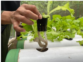
Gambar 1. Gaya kapilaritas air pada tanaman hidroponik dengan bantuan kain flanel

Berdasarkan hasil analisis data yang diperoleh selama pengamatan, konsep IPA yang terdapat dalam sistem hidroponik DFT yang pertama yaitu gaya kapilaritas air dari pipa paralon menuju ke kain flanel yang terhubung dengan rockwool dan akar. Kapilaritas adalah gejala naik atau turunnya permukaan fluida dalam pipa sempit (kapiler). Pada Hidroponik DFT tanaman tidak langsung terendam oleh air melainkan menggunakan bantuan kain flanel agar air, nutrisi, dan zat hara dapat sampai ke akar dan batang tanaman.