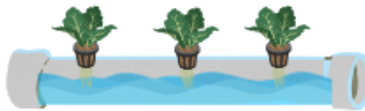
Gambar 3. Ilustrasi aliran air yang bersifat konstan

Berdasarkan hasil pengamatan, aliran air pada pipa hidroponik DFT mengalir secara konstan dan dengan kecepatan yang rendah sehingga aliran tersebut bersifat tunak. Aliran air dibuat konstan dan volume air yang digunakan relatif kecil agar tanaman hidroponik tidak menyerap air dan nutrisi secara berlebihan sehingga dapat tumbuh optimal. sistem aliran air dan nutrisi pada tanaman hidroponik adalah tertutup sehingga tanaman hanya mengandalkan aliran air dan nutrisi yang ada pada pipa, oleh karena itu debit air dan kecepatannya semaksimal mungkin dijaga agar tetap konstan.